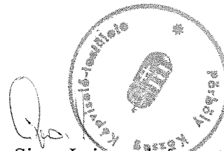
Sipos Lajos polgármester Pörböly Község Önkormányzata